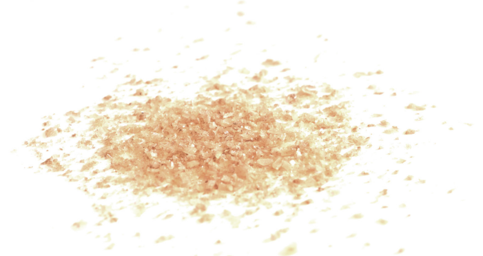
Steinsalz birgt als Kristall Struktur und Klarheit in sich