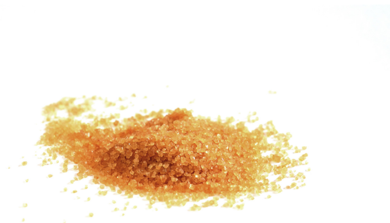
Brauner Zucker - Gut führen können heißt empathisch sein können