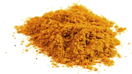
Curry – verschiedene Gewürze ergeben etwas neues Ganzes

Ich freue mich, Sie als Team mit meiner Methodenkompetenz ganz nach dem jeweiligen Bedarf zu unterstützen!